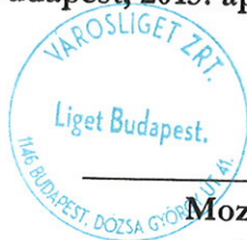
Mozsár István vezérigazgató Városliget Zrt.

PERFEKTUMPROJEKT PERFEKTUM PROJEKT KFT. 1036 BUDAPEST, PERC U. 2. ASZ.: 14592111-2-41